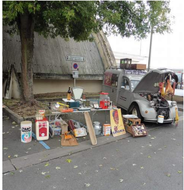
Exposition de voitures et le stand de Joël avec sa 2 CV épicerie