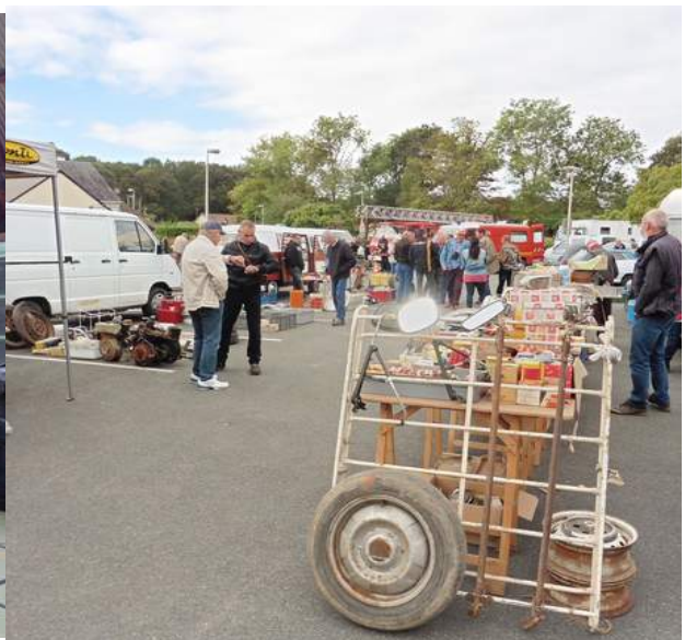
Exposants dans le gymnase et sur le parking à l'extérieur.