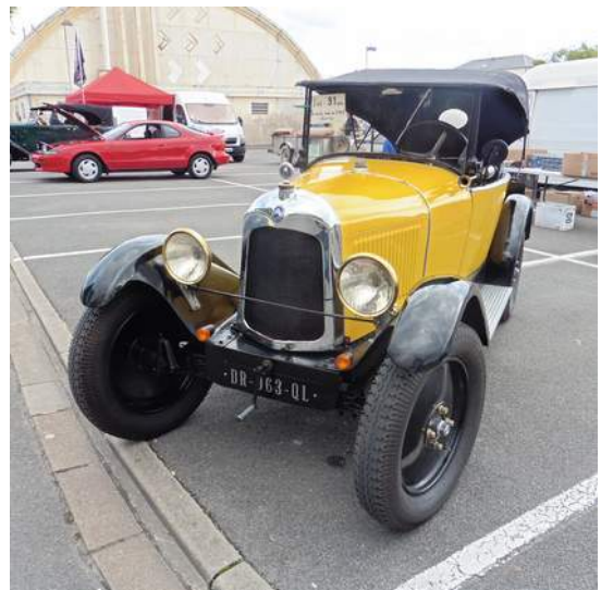
Exposition de véhicules des adhérents du JAO sur le parvis de la Mairie de Saran. Merci aux bénévoles du JAO d'avoir participé à cette journée et à nos amis Creusois du club ACVE d'être venus en voitures anciennes et de nous avoir aidés.