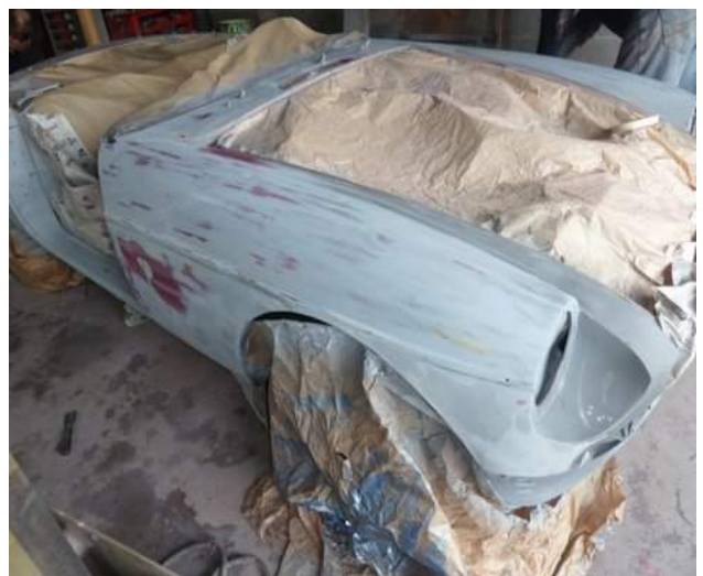
Préparation de la carrosserie avant peinture