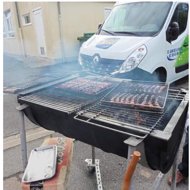
Différents points de cuissons